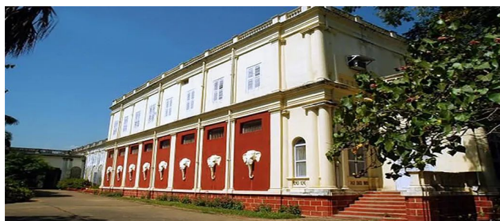
阿迪亚（Adyar）证道学学会国际总部，总部大楼

当证道学会成立时，它没有自己的著作，其成员的主要活动是在这个普世的证道学领域。但今天，经过 130 多年的发展，通过证道学会产生的文献涵盖了广泛的主题领域。它有一个形而上学的维度，教导宇宙的功能和构成、在不同生命形态中有其存在的目的、统治其发展的普遍规律等等。此外，现代证道学文献还谈到了正确的生活和证道学原理在日常生活中的应用，最后，还有大量书籍揭示了存在于不同神话、哲学、宗教和科学中的普世证道学。所有这些文献都被称为“ 现代证道学 ”（ modern Theosophy ，现在通常以大写的“T”开头）。