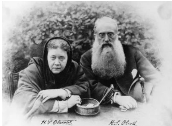
布拉瓦斯基 (H. P. Blavatsky) 与 奥尔考特 (H. S. Olcott)

“theosophers (证道者)”或“theosophists (证道学者)”这样的称谓。14 世纪的埃克哈特大师 (Meister Eckhart)，一群文艺复兴时期的哲学家，如 16 世纪的帕拉塞尔苏斯 (Paracelsus)，罗伯特·弗鲁德 (Robert Fludd)，17 世纪的托马斯·沃恩 (Thomas Vaughan) 和雅各布布·波墨 (Jacob Boehme)；以及 18 世纪的伊曼纽尔·斯威登堡 (Emanuel Swedenborg) 和卡尔·冯·埃卡茨豪森 (Karl von Eckartshausen) 等人都属于这种情况。最后，证道学运动在 19 世纪随着 1875 年由布拉瓦茨基夫人，奥尔考特 (H. S. Olcott) 等人创立 证道学会 (TS) 而重新出现。由此，某些永恒的真理再次以一种适合现代的方式被呈现，证道学会成员在 130 多年来的活动中创作了丰富的著作。